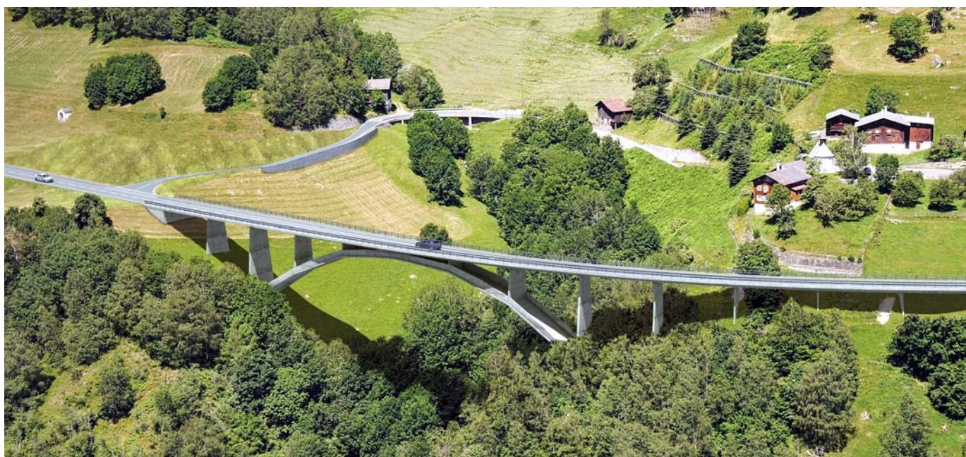
La Val Mulinaun cun la punt ARTG dal victur da la concurrenza da project en ina visualisaziun da computer.

ros d'inoltrar in project preliminar en il rom d'ina concurrenza da projects anonima.